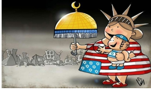
Şekil 6: "Yıkım" Konulu Propaganda Karikatürü