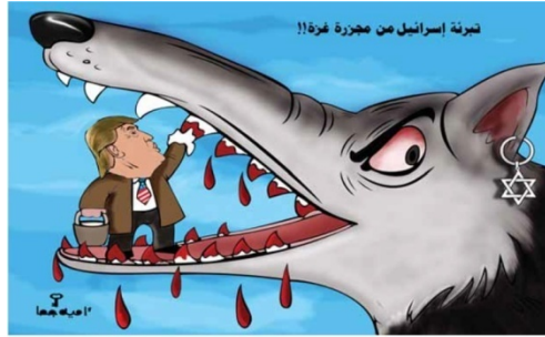
Şekil 3: "Kurt" Konulu Propaganda Karikatürü

"Kurt" konulu propaganda karikatürü, 17 Mayıs 2018 tarihinde Katar'da (ar-Raya) yayınlanmıştır. Gösteren açıdan bakıldığında, karikatürde büyük bir kurt köpeğinin ağzını sonuna kadar açtığı ve dişlerini gösterdiği aktarılmaktadır. Görsel kodlar içerisinde kurt köpeğinin ağzındaki dişlerden kan damladığı, kanların ise ABD Başkanı Trump tarafından temizlendiği gösterilmektedir. Kurt köpeğinin sol kulağında ise Yahudiliğin simgesi altıgen yıldız resmedilmektedir. Karikatürün sağ üst kısmında "İsrail'in Gazze katliamını temizliyor" yazılı kodu bulunmaktadır.