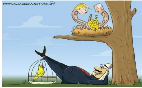
Şekil 7: "Bülbül" Konulu Propaganda Karikatürü

"Bülbül" konulu propaganda karikatürü 16 Mayıs 2018 tarihinde Katar'da (Al-Jazira) yayınlanmıştır. Gösteren açıdan analiz edildiğinde, karikatürde iki tane yılanın bir ağacın dalına çıktığı ve hemen altlarında da kafeste bir bülbülün resmedildiği görülmektedir. Yılanlarının önünde Kubberü's Sahra yer almaktadır. Görsel kodlar içerisinde ABD Başkanı Trump ile İsrail Başbakanı Binyamin Netanyahu'nun başları yılanların başları olarak yansıtılmaktadır. Diğer yandan bülbülün kafesine doğru bir Arap'ın ayaklarını uzatarak güldüğü aktarılmaktadır. Karikatürde herhangi bir yazılı kod kullanılmamıştır.