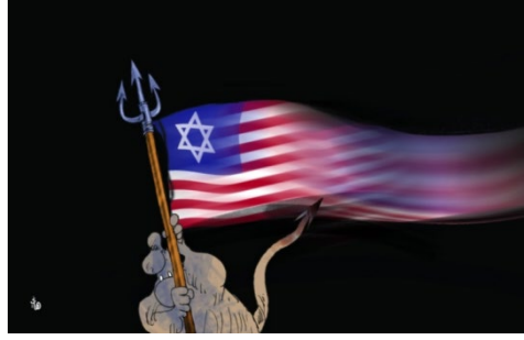
Şekil 5: "İblis" Konulu Propaganda Karikatürü

"İblis" konulu propaganda karikatürü 15 Mayıs 2018 tarihinde Londra'da basılan Arap gazetesi al-Hayat'da yayınlanmıştır. Gösteren açıdan analiz edildiğinde, karikatürde İblis'in elinde İsrail ve ABD bayraklarından oluşturulmuş bir bayrağı taşıdığı yansıtılmaktadır. Sunum kodlarında arka plan karanlık olarak aktarılmaktadır. Karikatürde herhangi bir yazılı kod kullanılmamıştır.